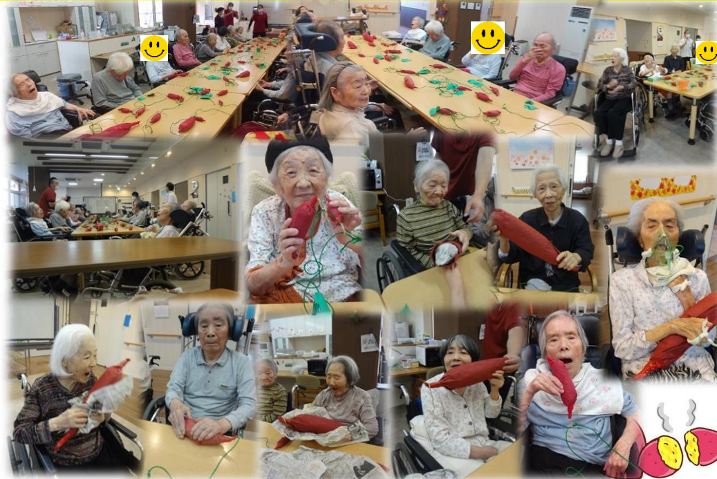
うめ・ももでお芋の収穫祭をしました！！お芋は、新聞紙を丸めて皆さんと一緒に作りました。大きな芋から小さな芋まで皆さんの力作です。収穫の時には、たくさん笑顔が見られとても楽しい時間となりました。