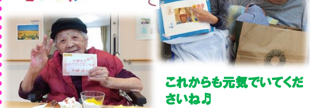
これからも元気でいてくださいな!