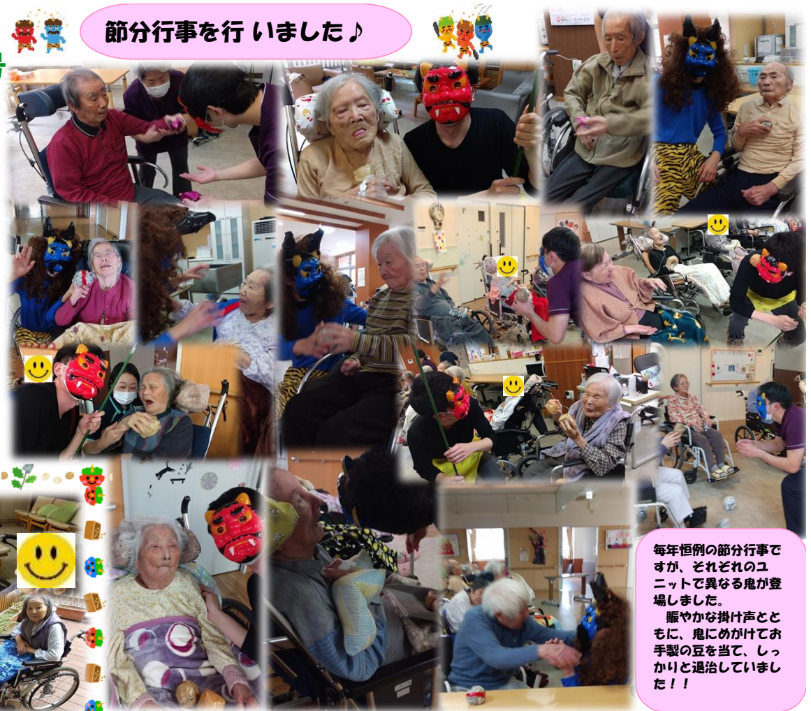
毎年恒例の節分行事ですが、それぞれのユニットで異なる鬼が登場しました。賑やかな掛け声とともに、鬼にめがけてお手製の豆を当て、しっかりと退治していました!!